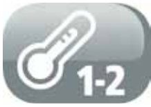
2 regolazioni di temperatura