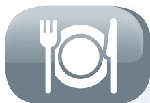
Numero di persone (5-6)